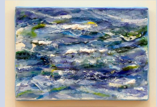
海洋ゴミを素材として制作した作品 有田大貴《波#12 宮島・観音・宇品》